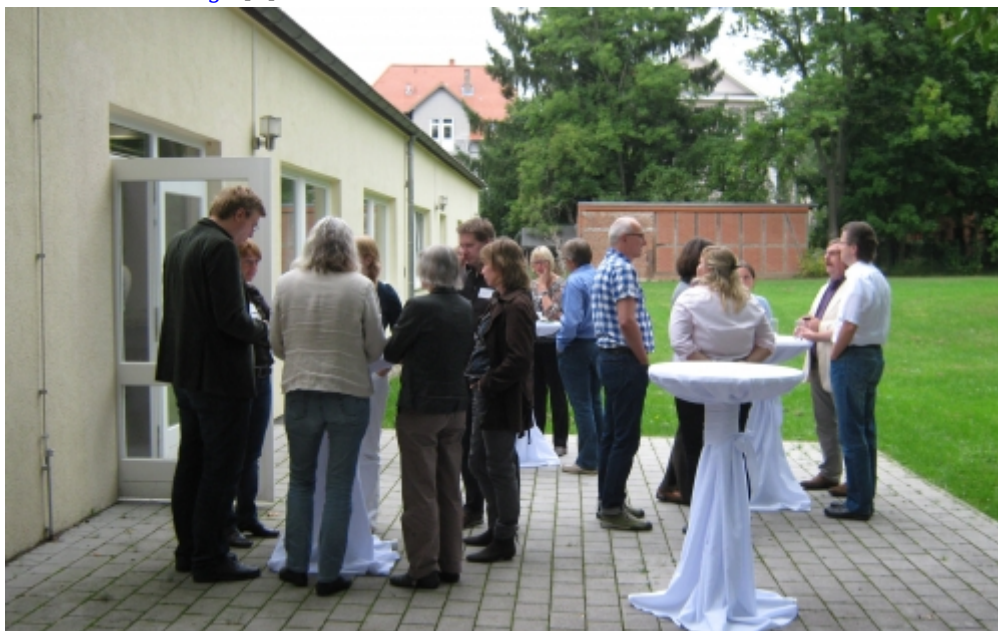
Diskussionen im Austausch-Café