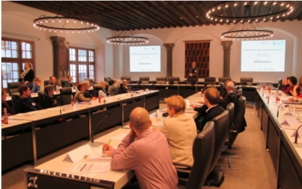
Teilnehmer des Arbeitstreffens im Großen Saal des Kemptener Rathauses