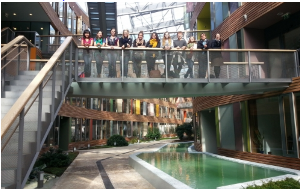
Moderne umweltfreundliche Architektur in Dessau: Das Umweltbundesamt