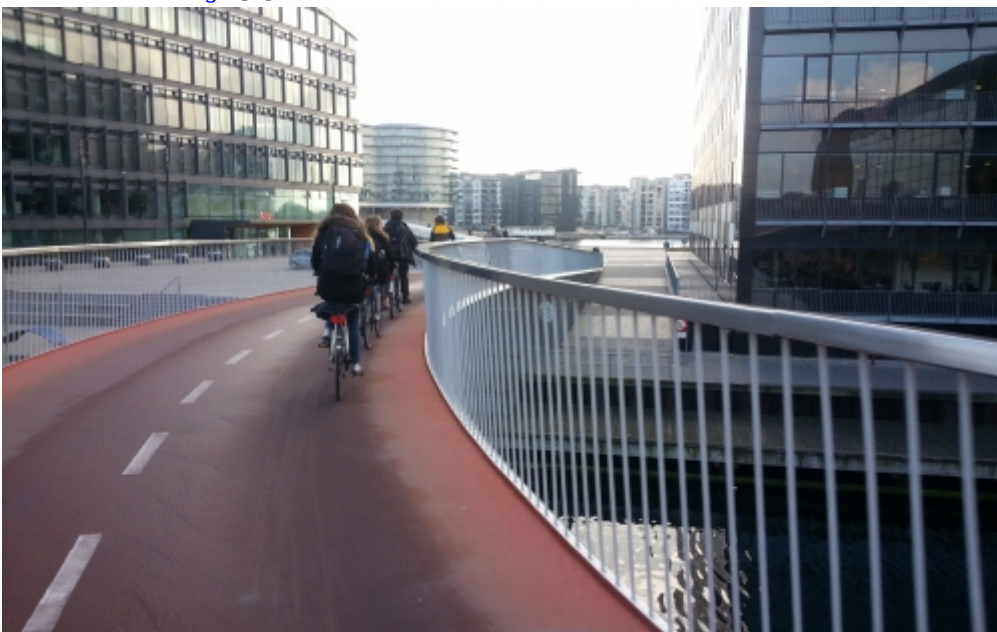
Radtour durch Kopenhagen