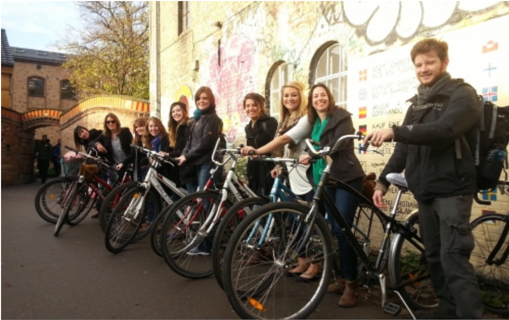
Fahrradexkursion nach Christiania, Kopenhagen