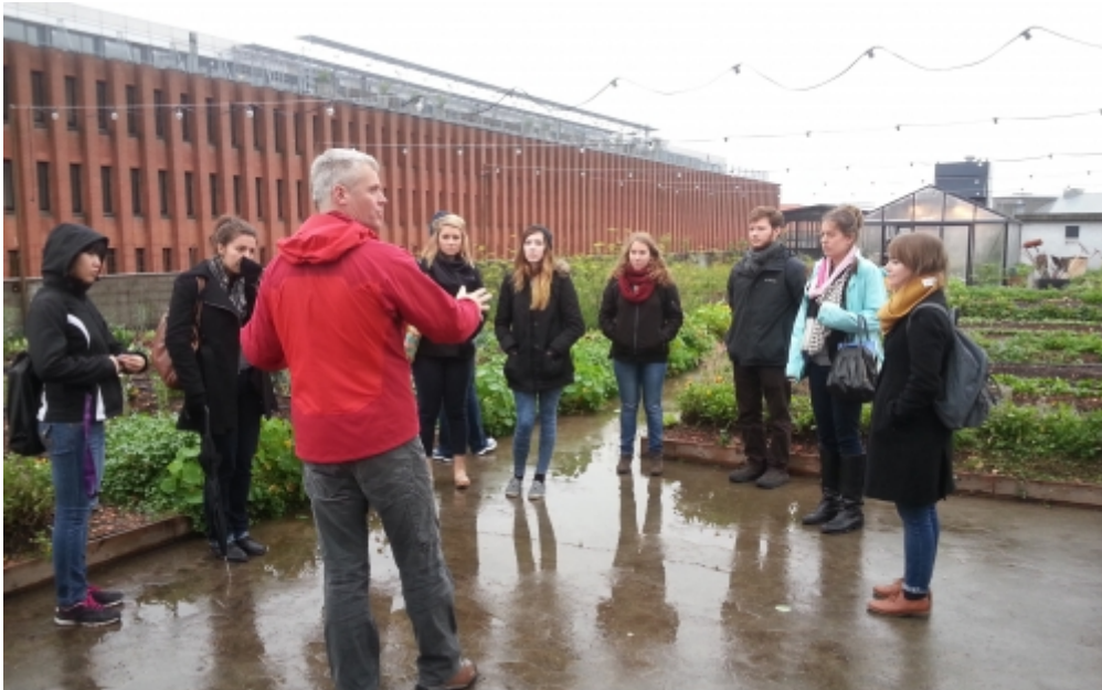
Urbanes Gärtnern in Kopenhagen