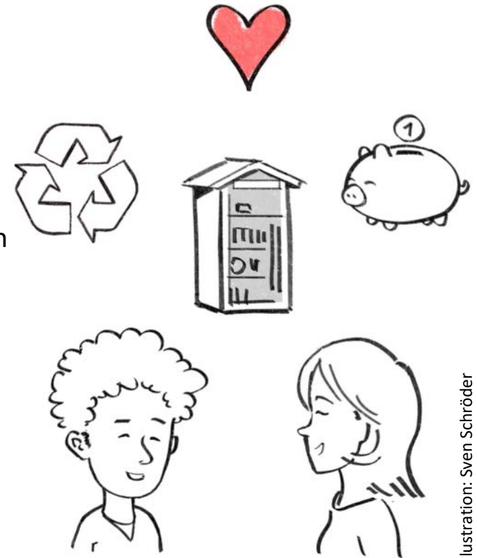
Illustration: Sven Schröder

Anne Neurath Berlins Weg zu Zero Waste BUND Berlin e.V. zerowaste@berlin.de