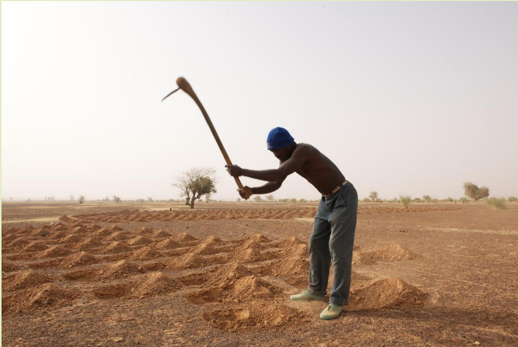
Abbildung 1 zeigt ein Beispiel nachhaltiger Landnutzungspraktiken (SLM) in den Trockengebieten von Mali.

können Herausforderungen darstellen, die das Risiko der Landdegradierung fördern (Chasek et al. 2018). Land(-nutzungs)rechte sind eine dieser Herausforderungen. Obwohl sichere Land(-nutzungs)rechte nicht per se Landdegradierung ausschließen können, kann die Abwesenheit eines Rechtssystems Landwirt*innen daran hindern, SLM-Praktiken anzuwenden (Dallimer et al. 2018).